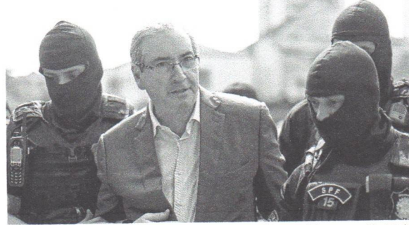
Defesa de Eduardo Cunha tentou conseguir no STF mesmo benefício concedido ao ex-presidente Lula

O ex-presidente da Câmara já havia formalizado um pedido, negado pela 10ª Vara Federal de Brasília, por isso recorreu do Supremo. No entanto, na avaliação de Lewandowski, como a ordem que beneficiou Lula prevê acesso apenas a mensagens relacionadas