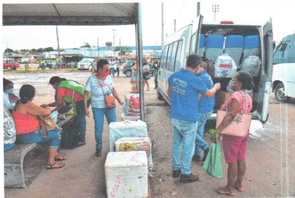
Movimentação de passageiros no terminal de vans, no KM 0 da BR-135, foi considerado alto na sexta-feira

de ontem, já tinha ocorrido um acidente, envolvendo um caminhão e uma motocicleta, no KM 4 da BR-135, apenas com danos materiais e ferimentos leves. "Houve aumento do fluxo de veículos na via federal, mas a polícia está atenta a qualquer tipo de