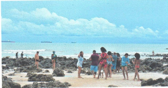
Famílias optaram por se divertir na praia; orla ficou bem concorrida na sexta-feira e faltou o uso de máscaras

"Todo fim de semana eu estou aqui. Acredito que pela questão do